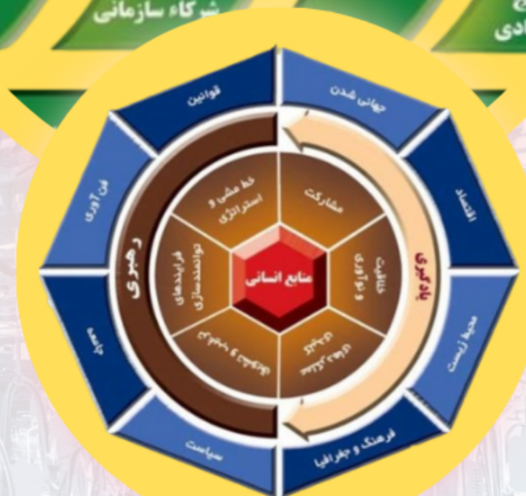
مدل جایزه منابع انسانی ایران