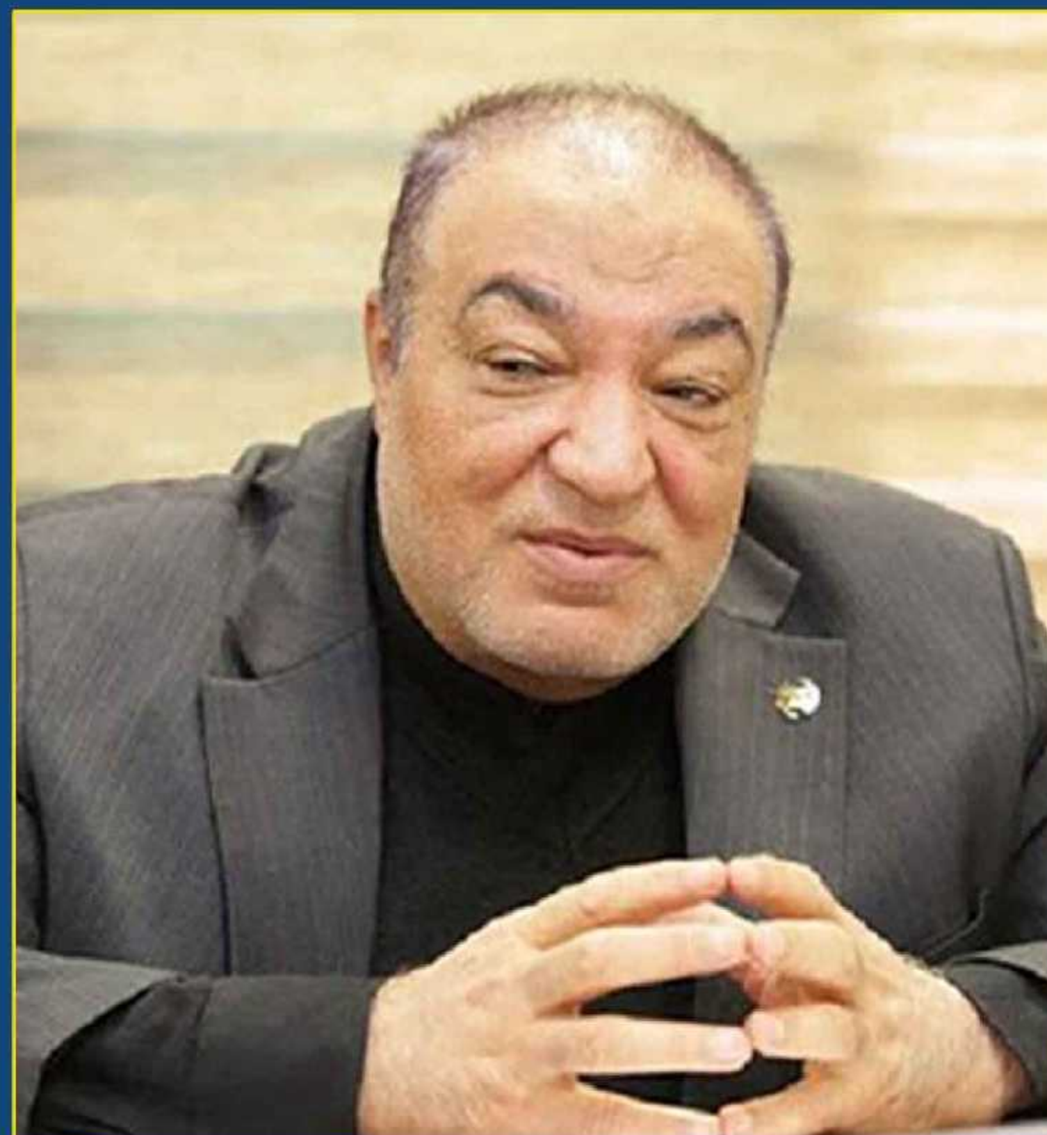
مهدی صفری معاون دیپلماسی وزارت امور خارجه