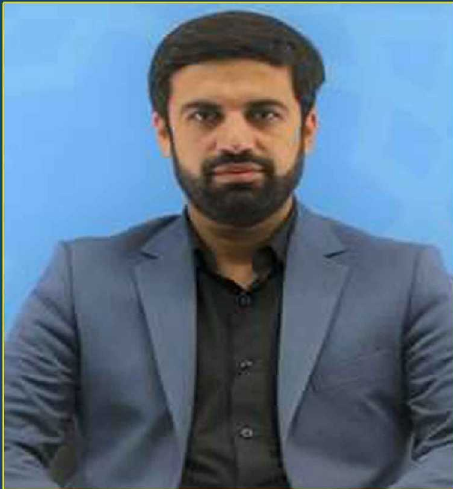
علیرضا پیمان پاک رئیس کل سازمان توسعه تجارت