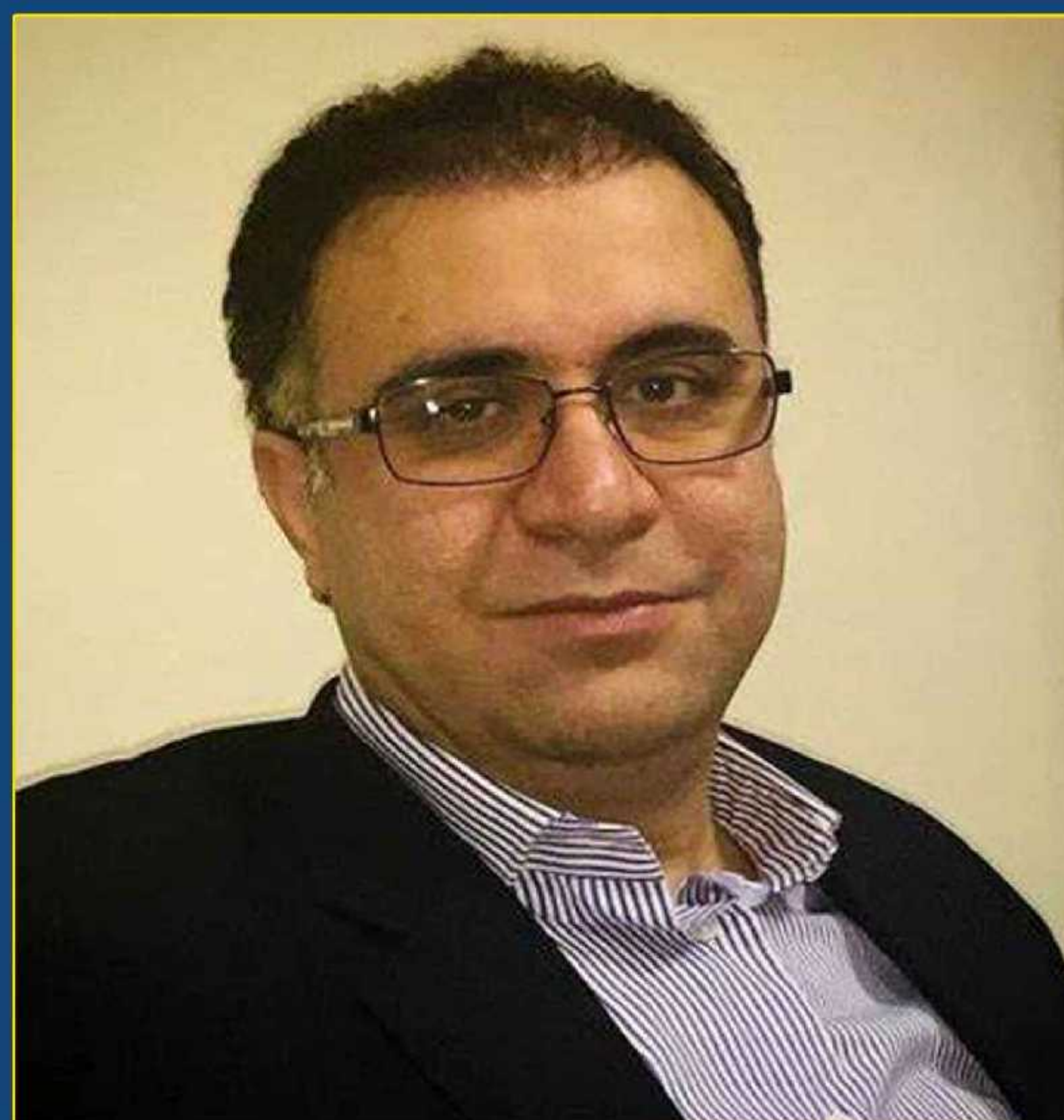
علی سعدوندی اقتصاد دان