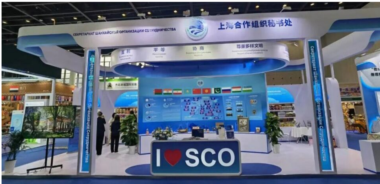
غرفه سازمان همکاری شانگهای در CAEXPO 2024

با توجه به روابط نزدیک سازمان همکاری شانگهای و انجمن آسه‌آن، دبیرخانه آن سازمان برای اولین بار به طور رسمی برای برپایی غرفه در این دوره نمایشگاه ASEAN-CHINA، دعوت شد و حضور یافت. غرفه سازمان، به وسعت حدود ۶۰ متر، محصولاتی از کشورهای عضو را به نمایش گذاشت. معرفی سازمان همکاری شانگهای در یک پوستر بزرگ شامل پرچم کشورهای عضو (شامل ج.ا.ایران) و چند بروشور انجام شده بود. دبیرکل سازمان همکاری شانگهای، آقای Zhang Ming در روز اول از نمایشگاه بازدید کرد.