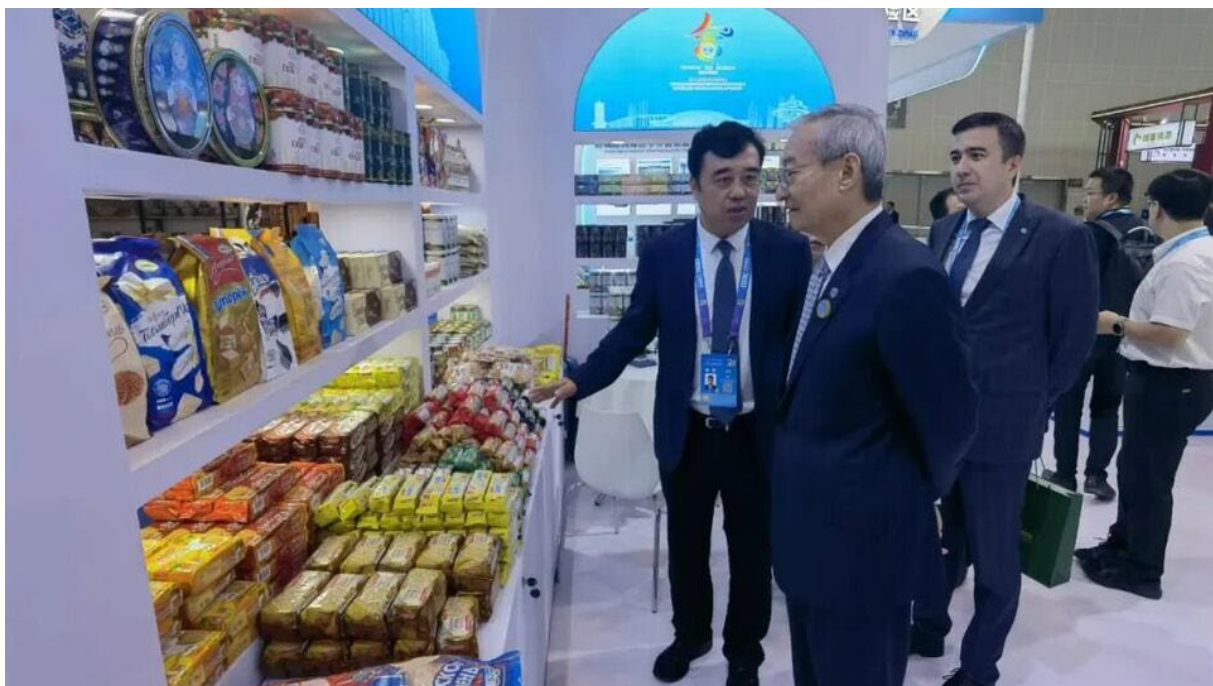
دبیرکل سازمان همکاری شانگهای در حال بازدید از غرفه سازمان