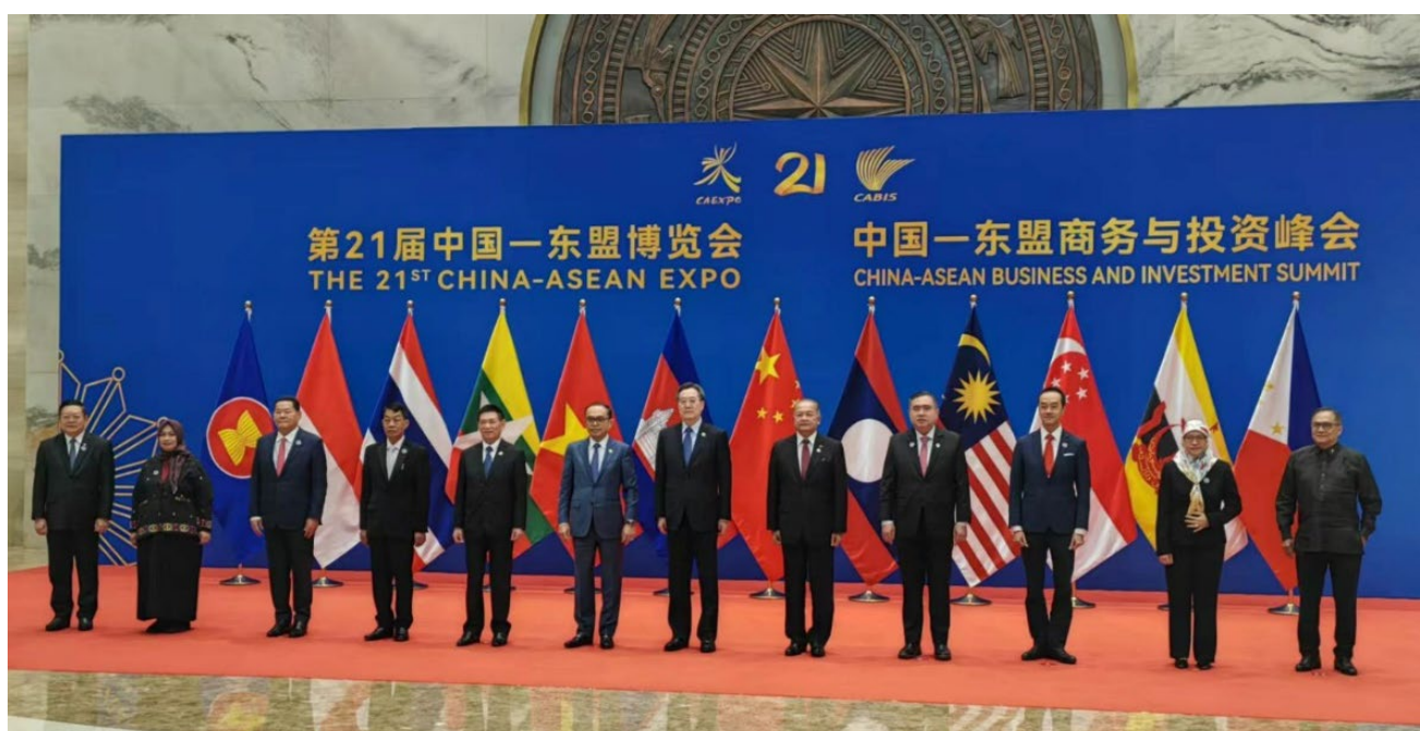
حضور مقامات کشورهای عضو در افتتاحیه

Koh Poh Koon - وزیر ارشد وزارت پایداری و محیط زیست سنگاپور