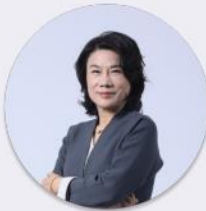
Dong Mingzhu President Gree Electric Appliance