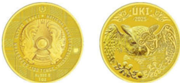
The gold investment coin UKI made of Au 999.9 gold weighing 31.1 grams with a face value of 100 tenge.

سرویس مطبوعاتی این بانک گزارش داد که بانک ملی قزاقستان سکه سرمایه گذاری دیجیتال UKI را در نمایشگاه جهانی پول در برلین در ۲۸ فوریه ارائه کرد. این ارائه جهانی از ویژگی های کلیدی راه اندازی و اجرای پروژه پرده برداری کرد.